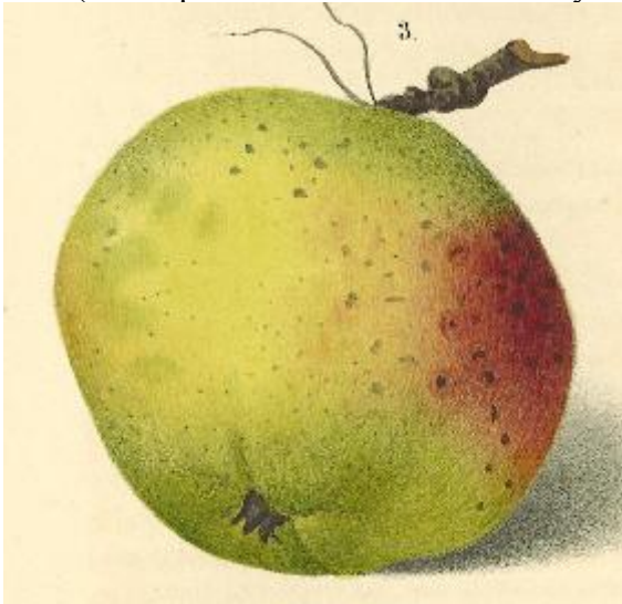
Diel pl.47, 1837 Diel, Kernobstsorten.

1855 (remarquez la différence avec Leroy...).